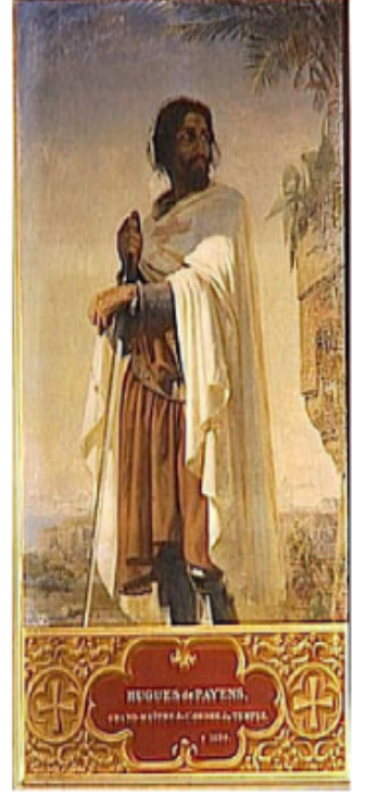
Hugues de Payens, İlk Büyük Üstat ve tapınağın kurucusu.

Mareşal: At ve teçhizat alımı, bölgesel komutanların yönetimi gibi askeri kararların alınmasından sorumluydu.