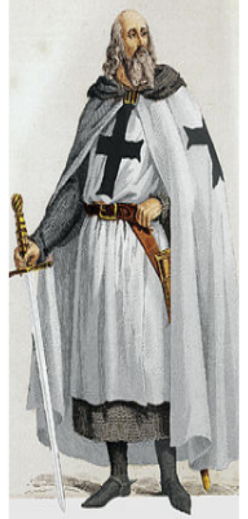
Jacques de Molay, Son Büyük Ustat.