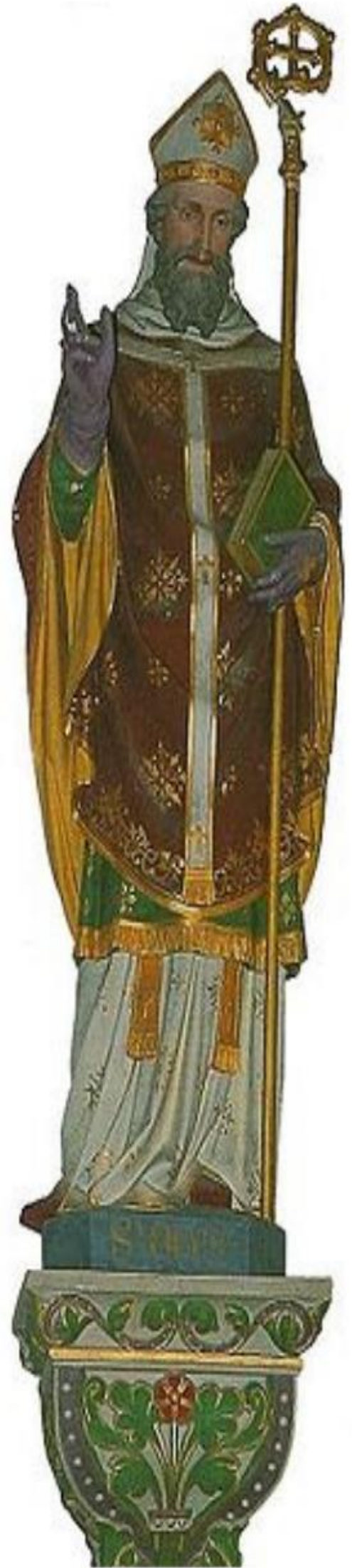
Kurucular arasında yer alan Godfred Saint-Omer'in adını aldığı Thérouanne piskoposu Audomar.

Çavuşlar: Şövalyelere kıyasla daha karmaşık bir toplumsal ve ırksal gruptu. Genellikle Ermeniler'den ve Suriyelilerden oluşurdu. Bunlar tek bir atla yetinmek ve kendi acemilerini bulmak zorundaydılar.