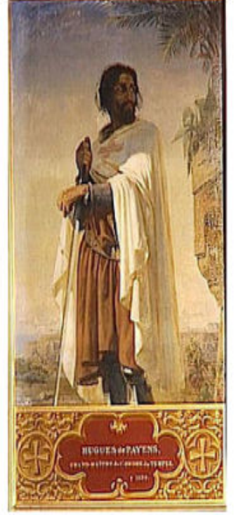
Hugues de Payens, İlk Büyük Üstat ve tapınağın kurucusu.

Mareşal: At ve teçhizat alımı, bölgesel komutanların yönetimi gibi askeri kararların alınmasından sorumluydu.