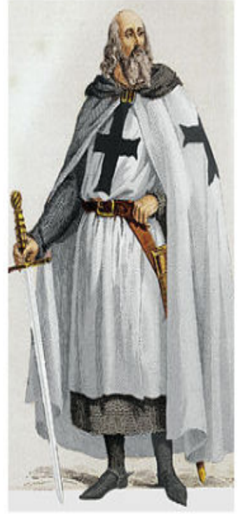
Jacques de Molay, Son Büyük Ustat.